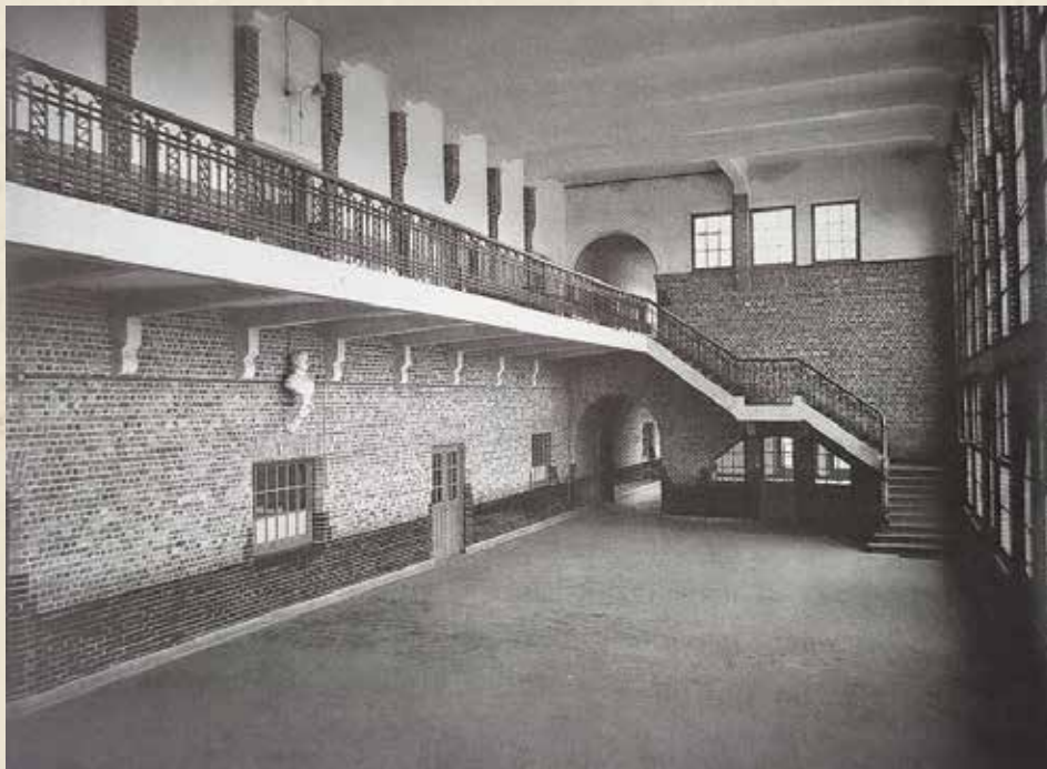
oorspronkelijke inkomhal hoofdgebouw