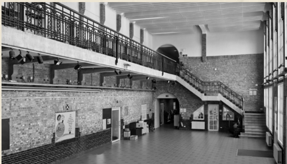
huidige inkomhal hoofdgebouw